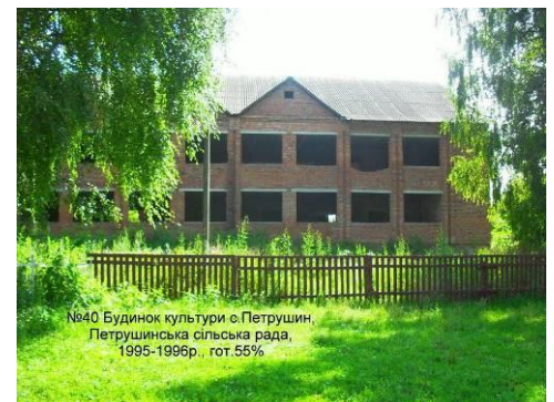
№40 Будинок культури с.Петрушин, Петрушинська сільська рада, 1995-1996р., гот.55%

Об'єкт незавершеного будівництва: Будинок культури Місце розташування: вул. Чернігівська, буд. 57, с. Петрушин, Чернігівський район, Чернігівська область, 15521 Варіанти використання: Для комерційної або виробничої діяльності Ступінь будівельної готовності: 55,0 % Площа ділянки: 0,70 га